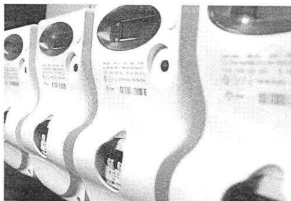
L'Autorità per l'Energia elabora un nuovo piano per le tariffe domestiche